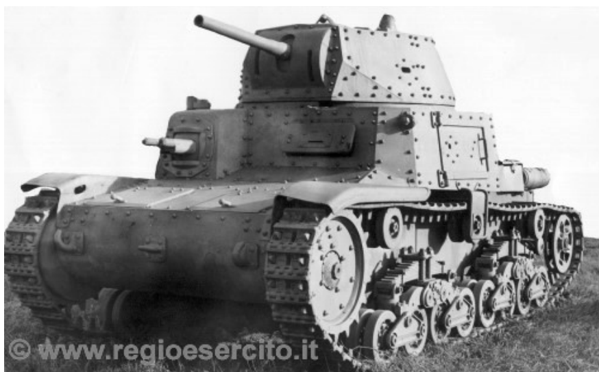
IL CARRO M40

settimana di sanguinosi combattimenti sono costretti a ripiegare nuovamente verso est, arrestandosi solo alla stretta di El Alamein, tra la costa e la depressione di Al Qattara.