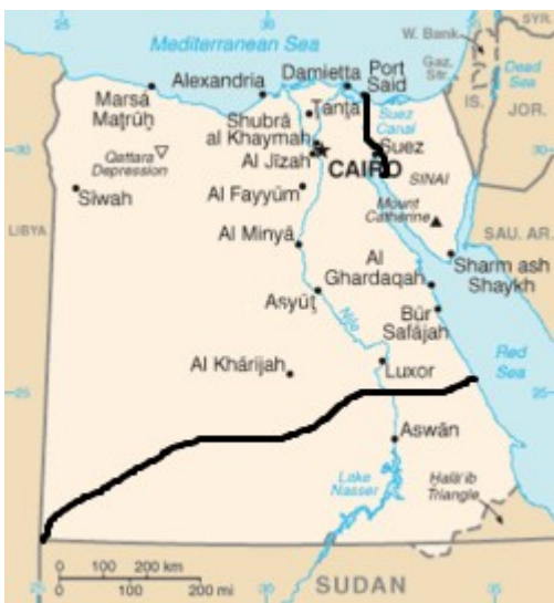
IL FRONTE EGIZIANO ALLA FINE DI AGOSTO

non sono riuscite a evacuare verso est a prendere contatto con le colonne avanzanti italiane e a sollecitarli a entrare velocemente ad Alessandria e a Il Cairo al fine di ripristinare l'ordine e di proteggere la popolazione civile europea rimasta intrappolata nelle due città. Il 12 agosto gli Italiani sono a Alessandria. Il 14 entrano a Il Cairo. Il 15 Balbo dispiega le truppe lungo il Canale di Suez, mentre gli Inglesi si sono attestati sulla sponda opposta. Mussolini il 20 agosto in sella a un cavallo bianco e brandendo la spada dell'Islam fa il suo ingresso trionfale ad Alessandria.