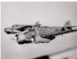
Una formazione di S79 italiani provenienti dall'Iraq si appresta a bombardare i pozzi petroliferi del Kuwait nel febbraio del 1941

Italiani rispondono con i semoventi pesanti Ansaldo fatti affluire dai porti siriani controllati da Vichy. I bombardieri italiani martellano incessantemente il porto di Bassora e le posizioni inglesi mettendo a dura prova il dispositivo britannico. Tra l'altro la presa dei pozzi petroliferi delle zone di Mossul e di Kirkuk permette agli Italiani finalmente di largheggiare con il carburante. All'inizio di febbraio però forze anglo/giordane attaccano l'Iraq da ovest. Gli italo/iracheni riescono anche qui a fermare gli invasori nella zona desertica a ovest dell'Eufrate, dove si combatte una battaglia di autoblinde e di colonne mobili molto diversa dalla guerra di trincea del fronte di Bassora.