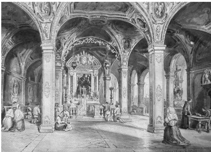
Vianetti, Cripta di Salerno, acquerello, 1846

Finito di stampare nel mese di dicembre 2023 da